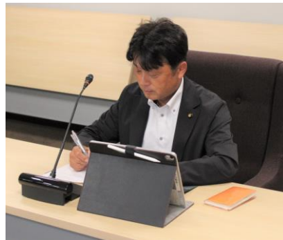
議会運営委員会会議中

今後も更なる移住や定住などで、多くの方々が宇佐市に来て頂ける様、市のパイプ役として頑張っておりますので、ご指導ご鞭撻の程よろしくお願い致します。