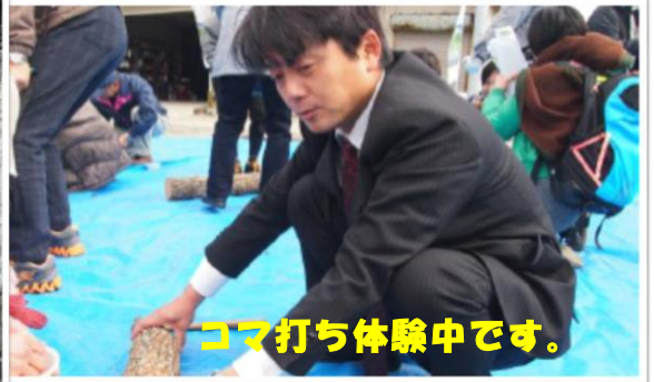
コマ打ち体験中です。