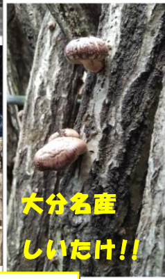
大分名産 しいたけ!!