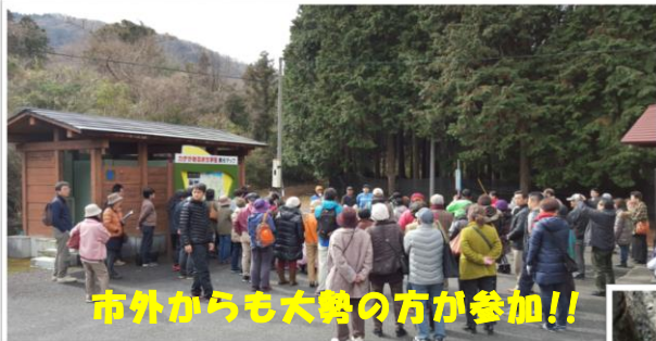
市外からも大勢の方が参加!!

2016年2月18日～19日 晴れ 今回初めて、スローフード食事会とくぬぎ林とため池がつなぐ農林水産循環地域を散策しました。イベントでは椎茸の駒打ち体験など有りみなさん楽しんでおられました。遠くからは長崎から来ていた団体さんの方も居ました。